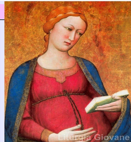
«Ecco la serva del Signore: avvenga per me secondo la tua parola». (Lc 1, 38)

L'altissima missione di Maria infatti si compie con la Maternità della Chiesa. La Chiesa, pure essa sposa di Cristo, con un cammino inverso a quello di Cristo e di Maria è chiamata a divinizzarsi, ad assumere in sé la divinità di Cristo con l'essere anch'essa figlia di Maria.